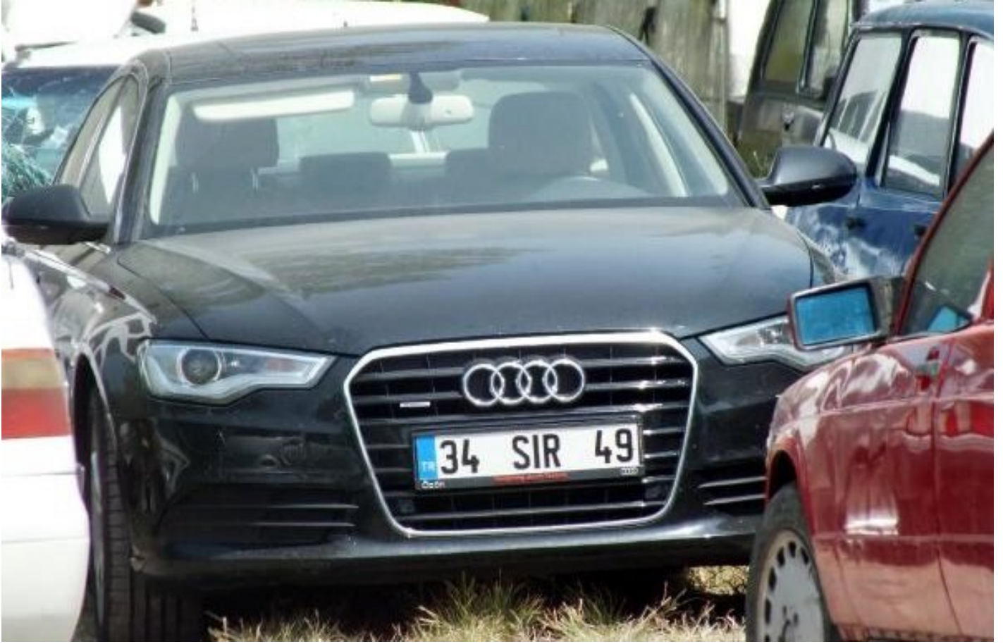
Adil Öksüz'ün 'SIR' plakalı aracı

Öksüz'ün Sakarya'da gidebileceği yerlere baskın düzenlenirken, tüm aramaları rağmen kendisine ulaşamadı.