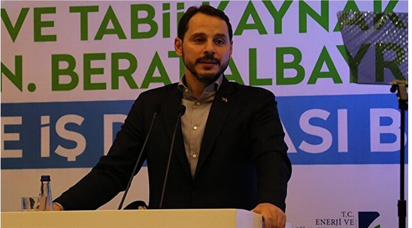
Enerji ve Tabii Kaynaklar Bakanı Berat Albayrak

Haber Merkezi · 09 Haziran 2018, 19:56 · Son Güncelleme: 09 Haziran 2018, 20:10 · AA