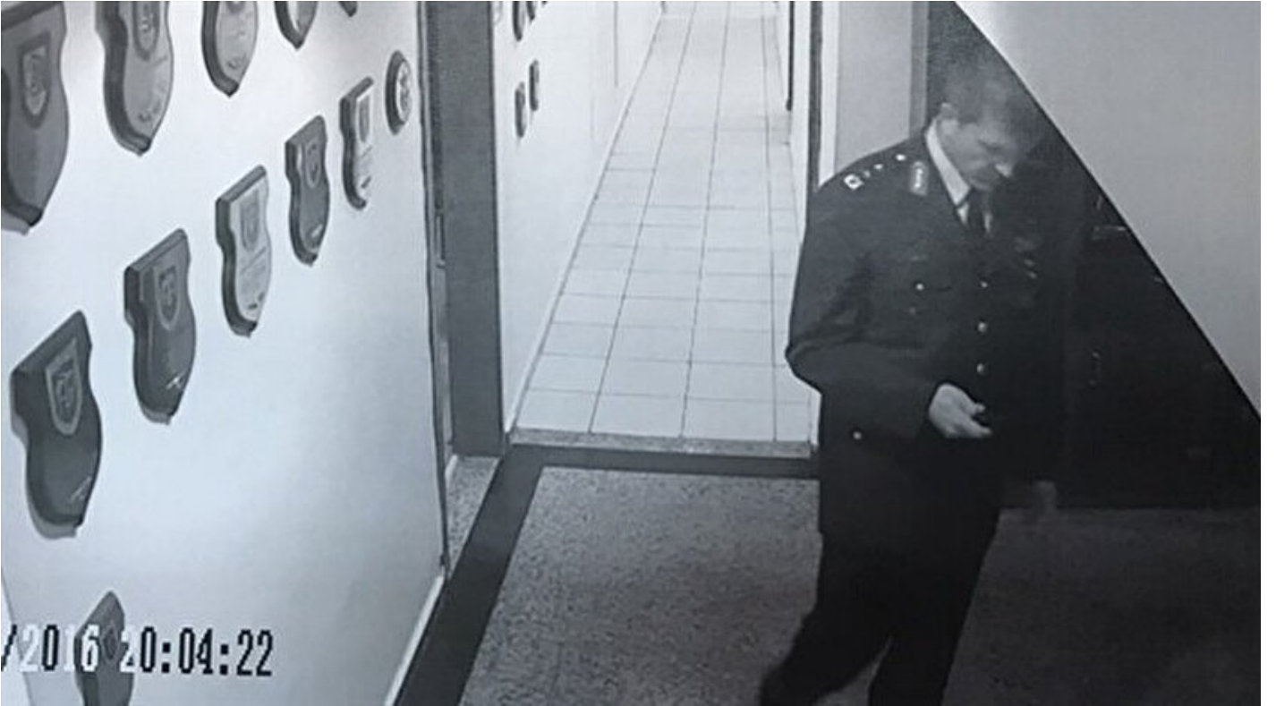
Tören kıyafetiyle Akıncı'da