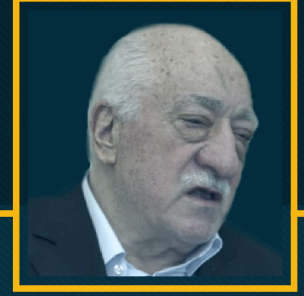
Fetullahçı Terör Örgütü elebaşı FETULLAH GÜLEN