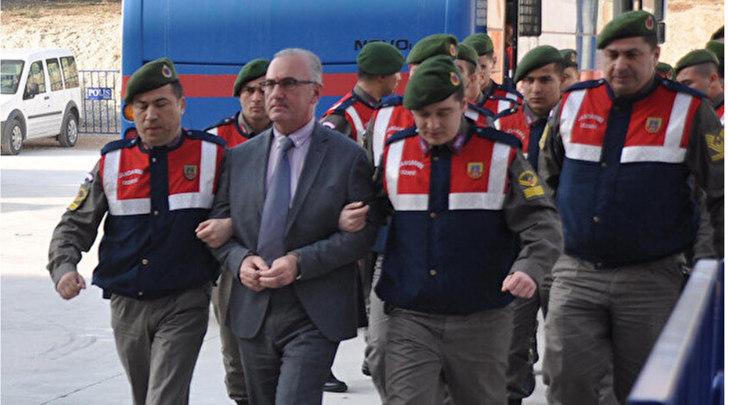
Eski Denizli Garnizon ve 11. Komando Tugay Komutanı tuğgeneral Kamil Özhan Özbakır

Haber Merkezi · 21 Şubat 2019, 11:37 · Son Güncelleme: 21 Şubat 2019, 12:12 · AA