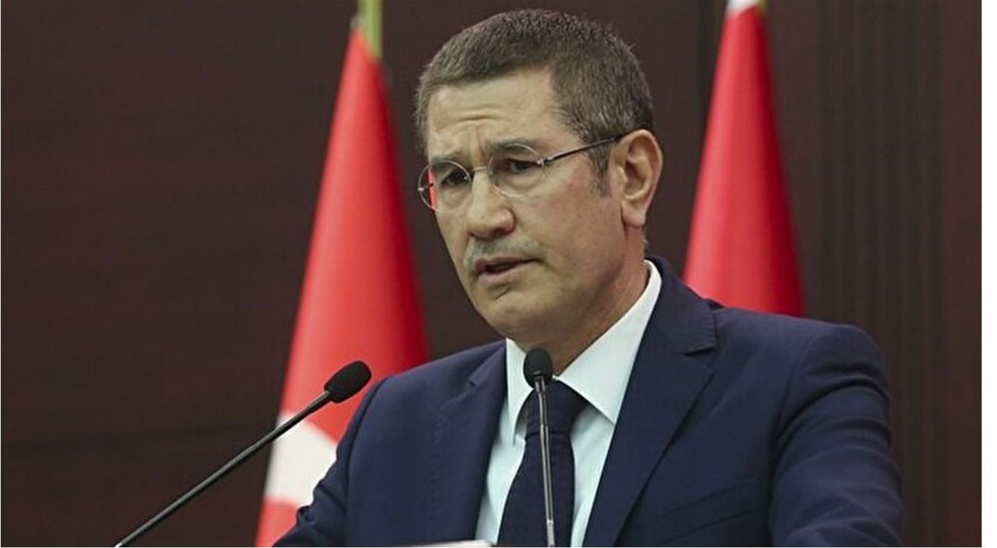
Milli Savunma Bakanı Nurettin Canikli