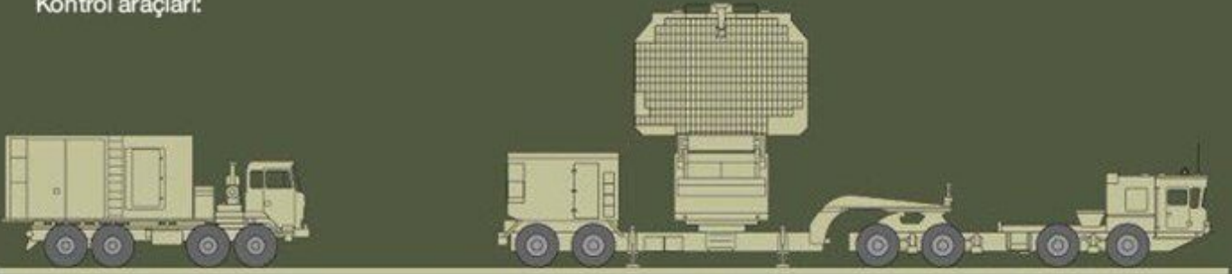
55K6E Muharebe Kontrol Mekanizması