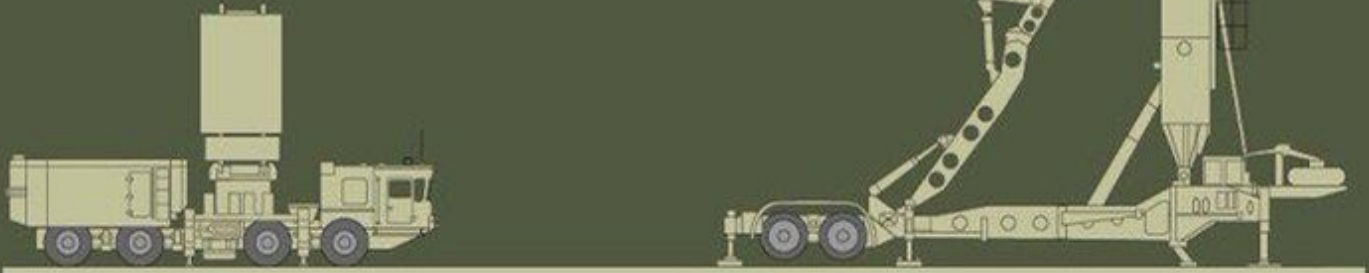
RLS 979L6E radar