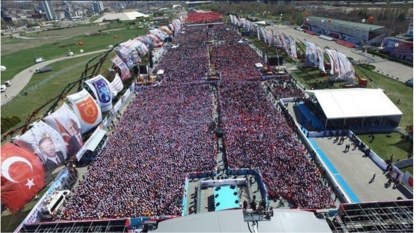
Ankara'da düzenlenen toplu açılış töreninde tarihi kalabalık...

istikrarın bir Türkiye için "Evet" diyor mu? İşte o an Diyarbakır'daydık. Diyarbakır "Evet" diyor. Diyarbakır çok çekti. Şimdi özgürlüklerin, barışın yeni bir milat oluşturduğu bir yapıyla yollarda, meydana baktım ki Diyarbakır "Evet" diyor. İyi olan, güzel olan, ülkemizin faydası olan gelişmelerin tek bir şartı vardır. Bu şart istikrardır, güvendir. 1960'dan beri istikrarımızı tehdit eden onlarca hadiseye rağmen gereken tedbiri alamadık. Özal'dan, Demirel'e, Erbakan'dan Yazıcıoğlu'na hepsi aynı noktada buluştu. Ama bir türlü adım atılamadı. Ben de hep bunu dillendirdim. Ama gereken mesafeyi kat edemedik. Sürekli engeller çıkartıldı. 2007 Cumhurbaşkanlığı seçimi sırasında bir engeli aştık. Bu, Cumhurbaşkanı'nın halk tarafından seçilmesi idi."