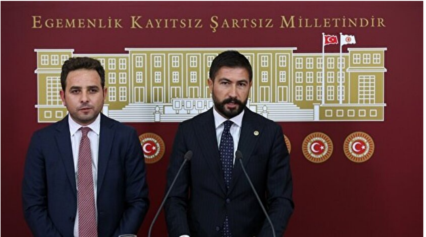
AK Parti Denizli Milletvekili Cahit Özkan

Haber Merkezi · 17 Ocak 2018, 17:45 · Son Güncelleme: 17 Ocak 2018, 17:50 · AA