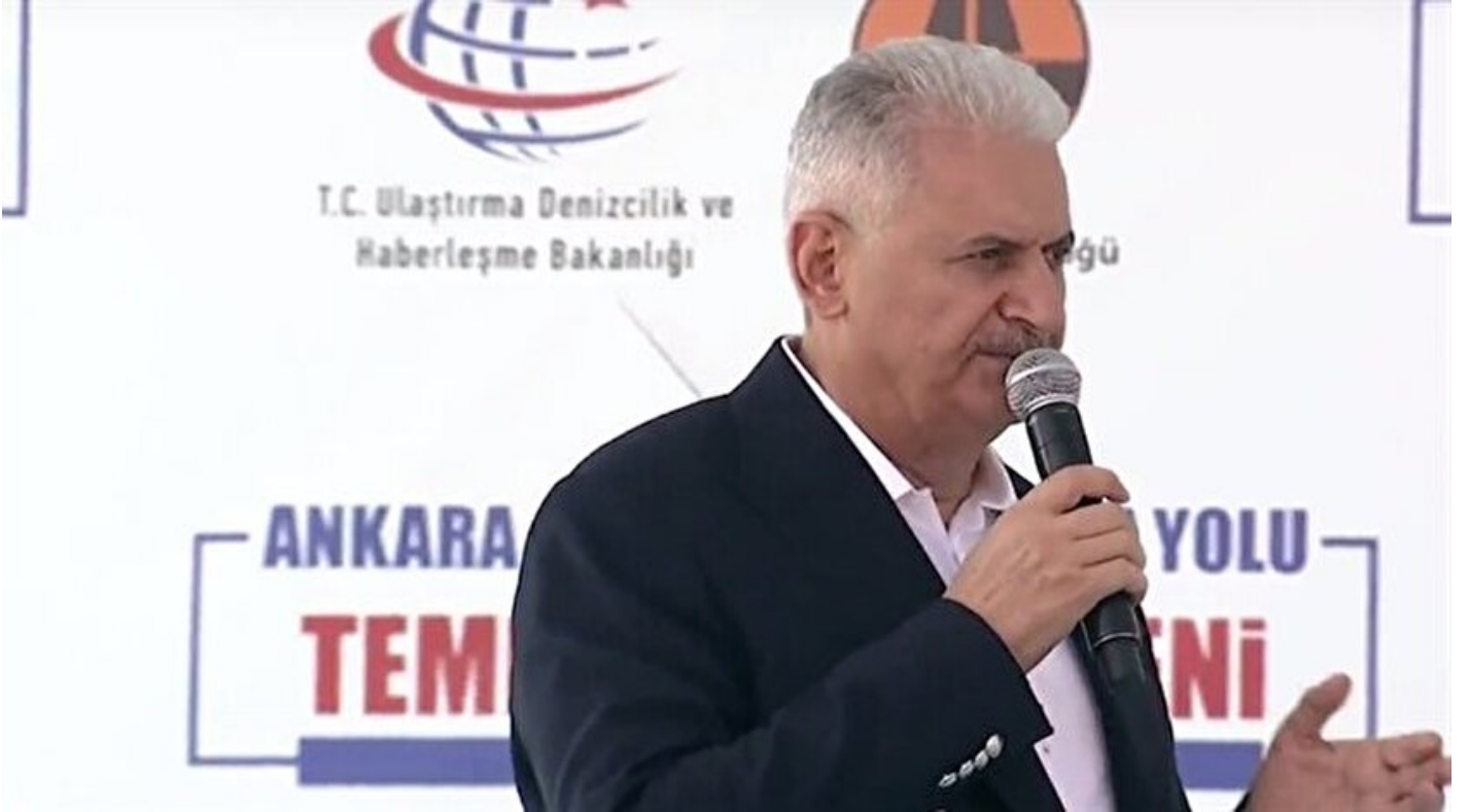
Başbakan Binali Yıldırım

Haber Merkezi · 18 Ağustos 2017, 15:07 · Son Güncelleme: 18 Ağustos 2017, 15:52 · Yeni Şafak