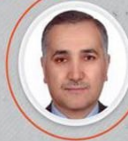
FETÖ'nün "hava kuvvetleri imamı" Adil Öksüz