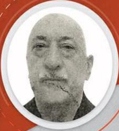
1 numaralı firari Fetullah Gülen

■ K.K.K'dan 100 subay ile 12 astsubay, D.K.K'dan 18 subay ile 9 astsubay ve H.K.K'dan 4 subay ve 4 astsubay firariler arasında yer alıyor