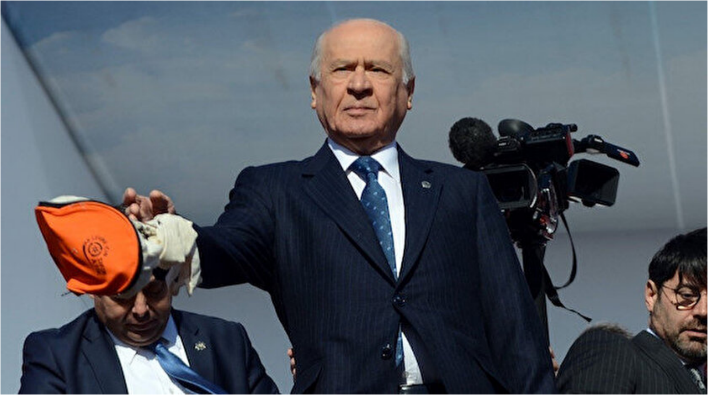
MHP Lideri Devlet Bahçeli