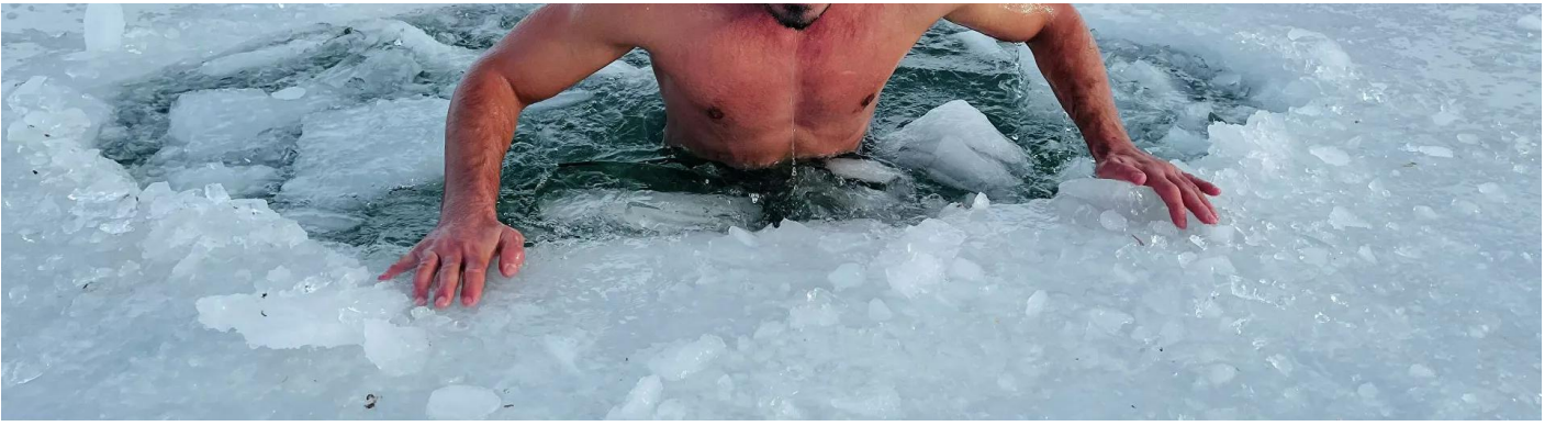
Youtuber buz tutmuş göle daldı, hipotermi tehlikesi geçirdi Sosyal Medya