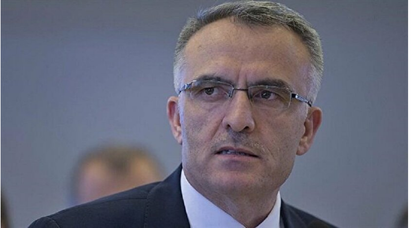
Maliye Bakanı Naci Ağbal

Haber Merkezi · 07 Kasım 2016, 11:49 · Son Güncelleme: 07 Kasım 2016, 13:31 · AA