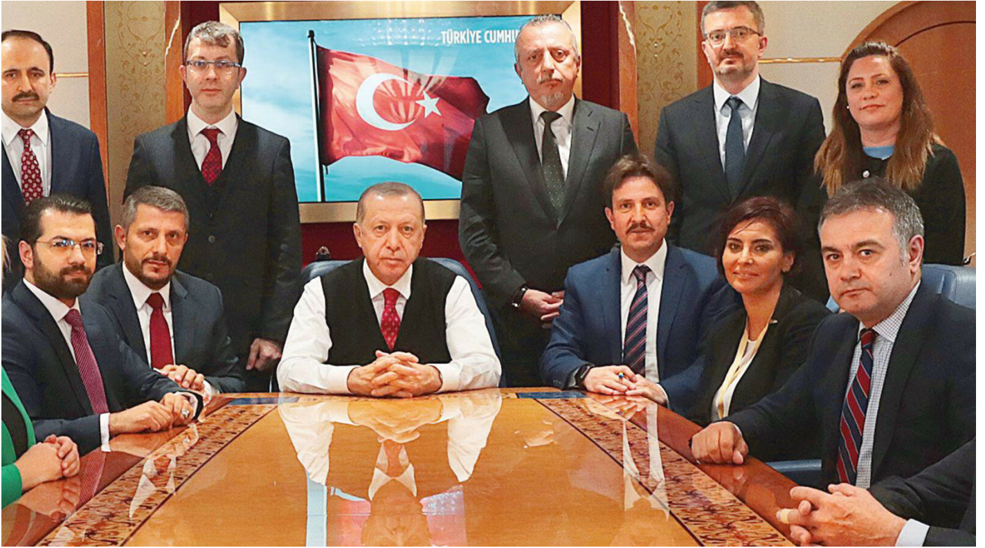
Cumhurbaşkanı Recep Tayyip Erdoğan

Belediye başkanları ile parti organlarında olan arkadaşların durumu ay sonuna kadar vakti var. Şu anda da çalışmalarını sürdürüyorum. Büyük şehirlerimiz üzerindeki çalışmalarımızın çok çok önemi var. Belli bir noktaya kadar gelmedik diyemem; geldik, devam edeceğimiz arkadaşlar var. Üç dönem belediye başkanlığı yapmış arkadaşlarımızı da büyük oranda istirahate çekeceğiz. Hepsi için geçerli mi bu? Tamamına yakını için geçerli. Çünkü halk değişim istiyor. Değişim isteği için biz üç dönem aynı yerde belediye başkanlığı yapmış arkadaşları dördüncü dönem için aynı yeri düşünmüyoruz. Ha ne olabilir? Dördüncü dönem bir başka yerde bir başka il veya ilçede belediye başkanı aday olabilir. Bu daha ziyade ilçeler bazında böyle olur.