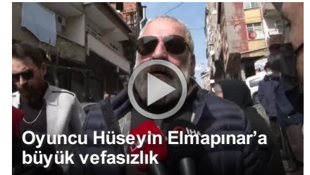
Oyuncu Hüseyin Elmapınar'a büyük vefasızlık