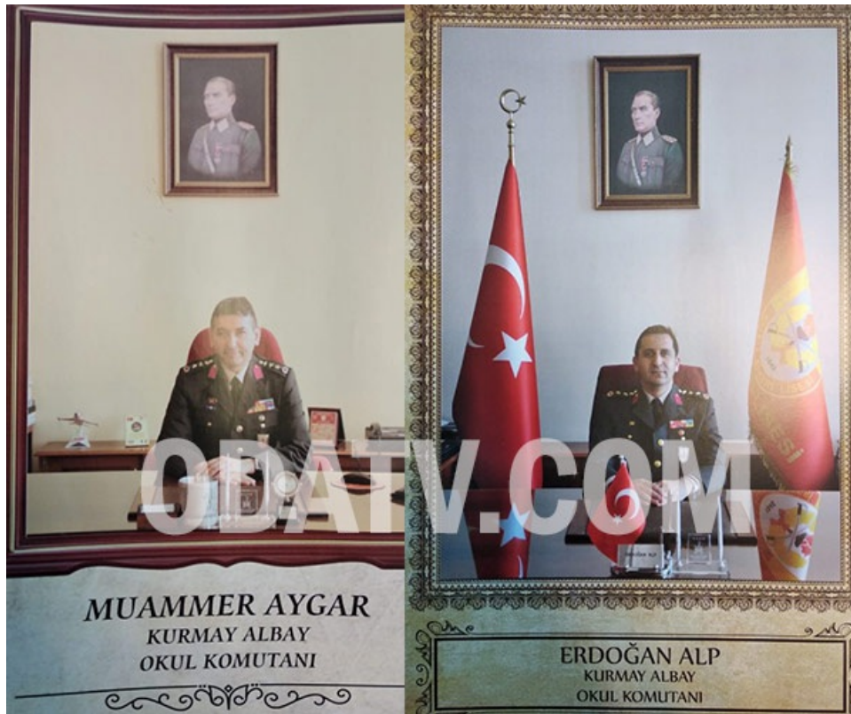
(Kuleli Askeri Lisesi yıllıklarında o komutanlar)