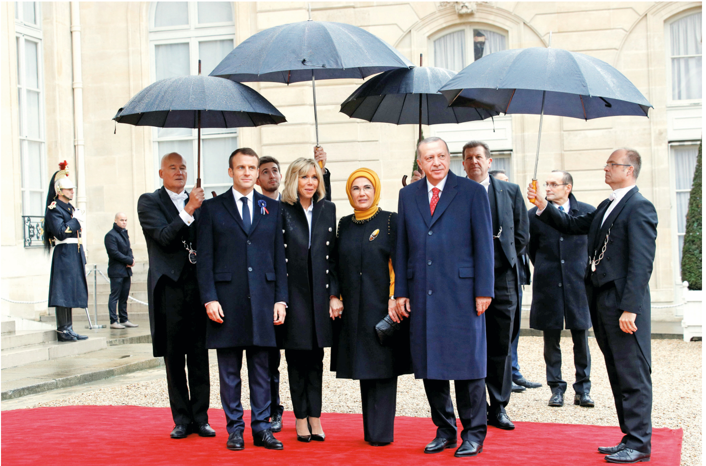
Cumhurbaşkanı Erdoğan ve eşi Emine Erdoğan'ı Elize Sarayı'nda Fransız mevkidaşı Emmanuel Macron ile eşi Brigitte Macron karşıladı.

“Son yıllarda Türkiye’nin güney komşuları Irak ve Suriye’de yaşanan iç karışıklıklar, artan terör tehdidi ve derinleşen istikrarsızlık ile Filistin’de on yıllardır şahit olduğumuz sistematik mülksüzleştirme ve yurtsuzlaştırma çabaları, bu durumun en somut göstergeleri arasındadır. Birinci Dünya Savaşı, dönemin büyük güçleri tarafından masa başında cetvelle çizilen sınırlar uyarınca birtakım sorunlu siyasi yapıların oluşumunu beraberinde getirmiştir. Dahası bu siyasi yapıların hükmettikleri toplumlarla güçlü bağlar kuramaması Ortadoğu ve Kuzey Afrika bölgelerinin 20. yüzyıl boyunca otoriter rejimler, askeri darbeler ve azınlık yönetimleriyle anılması sonucunu doğurmuştur. Dışlayıcı yapıları yıllarca destekleyenler Arap Baharı olarak adlandırılan demokratik halk hareketlerinin engellenmesi için de seferber oldular. Amaçlarına ulaşmak için askeri darbeler dahil her türlü anti-demokratik yönetime başvurular. Bu aktörler, karşı devrimci faaliyetlerini bugün de kararlılıkla sürdürmekte; küresel barış ve istikrarı kendi çıkarları uğruna tehlikeye atmaktadırlar.”