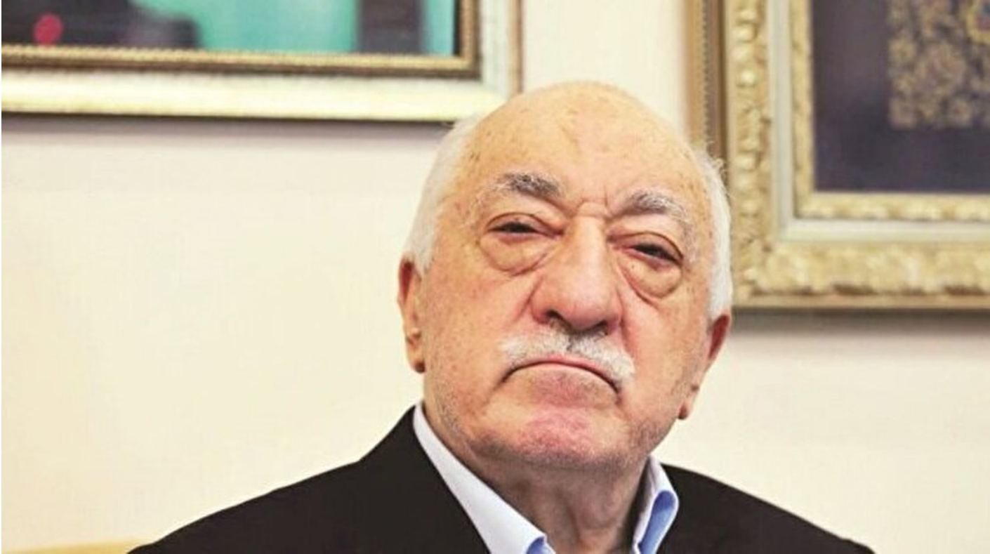
FETÖ elebaşı Fethullah Gülen