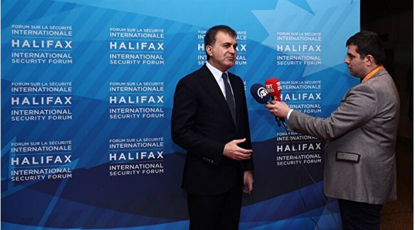
AB Bakanı Ömer Çelik

Haber Merkezi · 19 Kasım 2017, 22:47 · Son Güncelleme: 19 Kasım 2017, 22:49 · AA