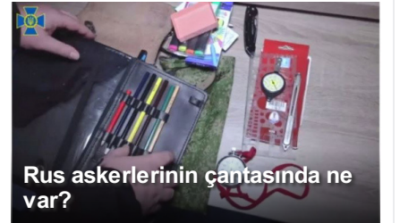
Rus askerlerinin çantasında ne var?