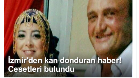
İzmir'den kan donduran haber! Cesetleri bulundu