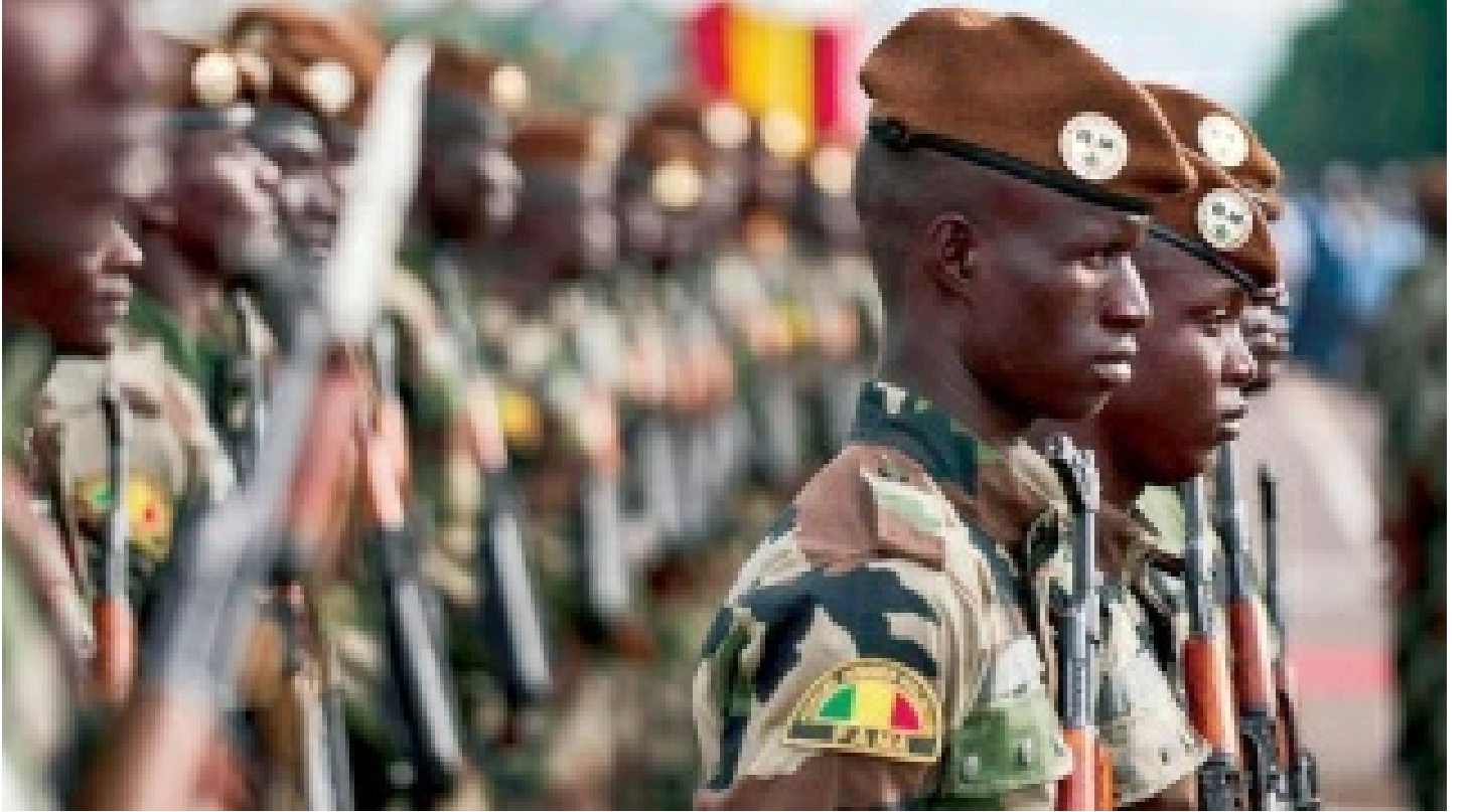
Mali'de ordu üssüne saldırı: 46 asker öldü