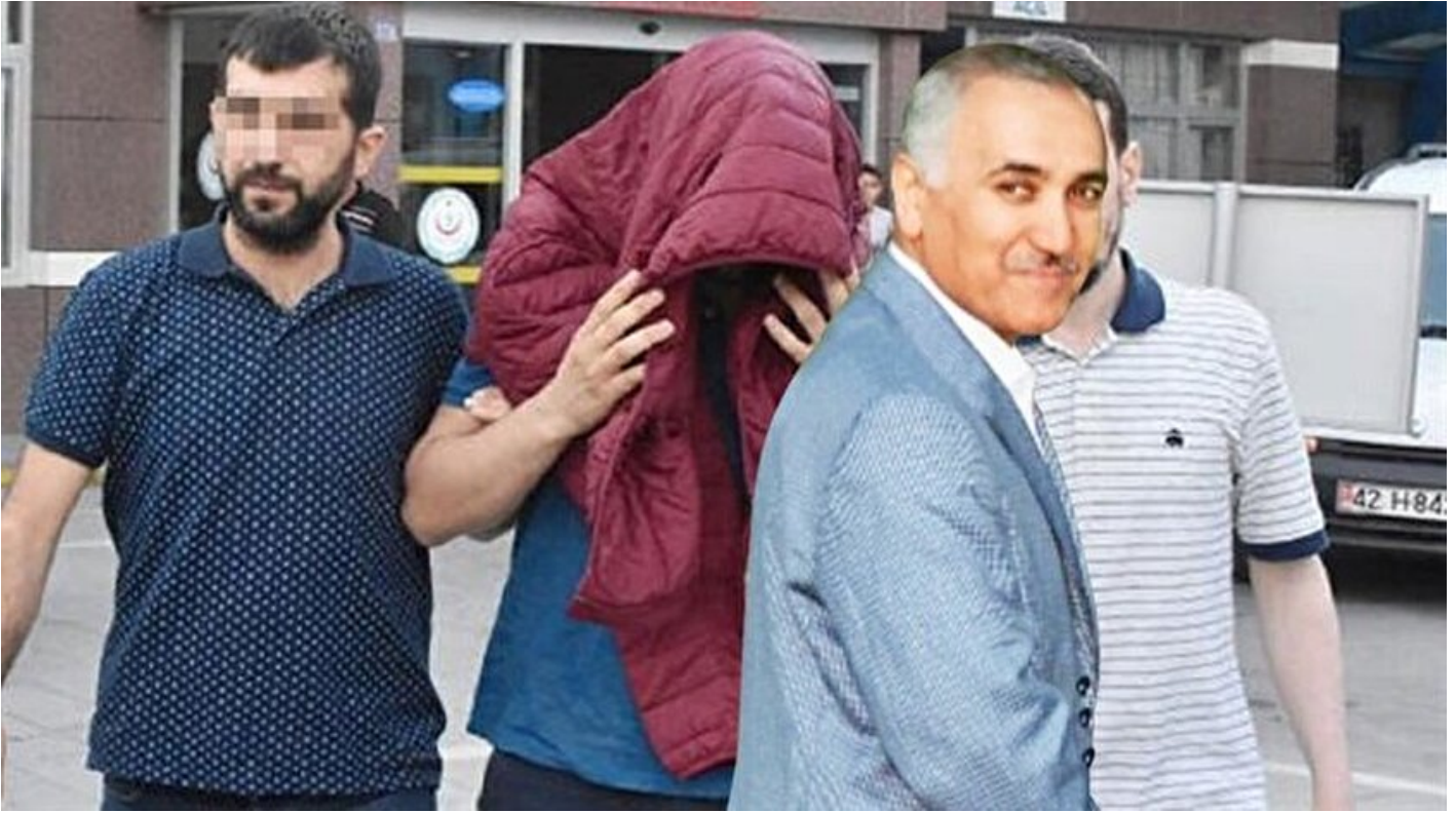
Adil Öksüz'ün bacanağı