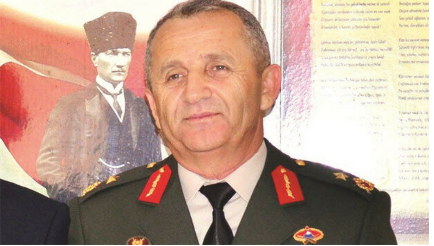
Giresun eski Jandarma Bölge Komutanı Tuğgeneral Mustafa Doğru.

Dođru, GATA'daki tedavisi devam ederken tutuklandı. Önce Sincan Cezaevine konulan Dođru, tedavisinin tamamlanması için Metris Cezaevine konuldu. Dođru hakkındaki davanın hangi mahkemede görüleceđi ise uzun bir zaman aldı.