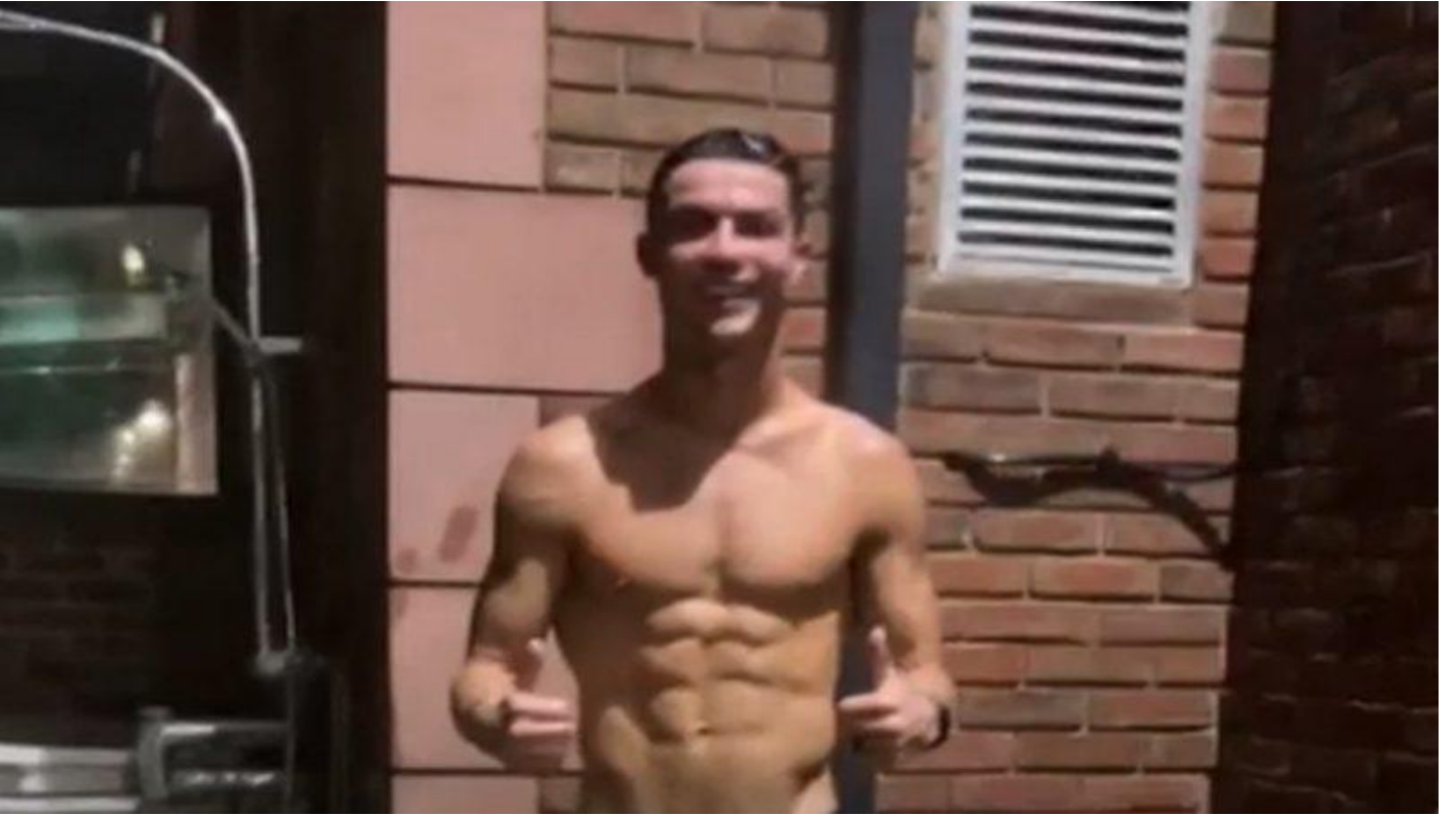
Ronaldo canlı yayında duş aldı, 1 milyon kişi izledi Sosyal Medya