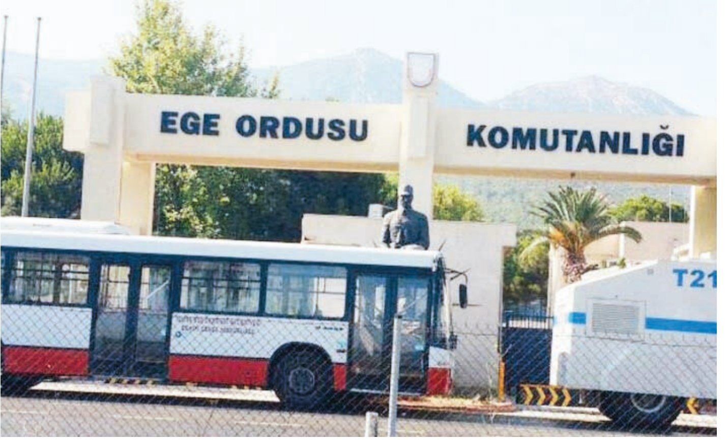
Ege Ordusu Komutanlığı