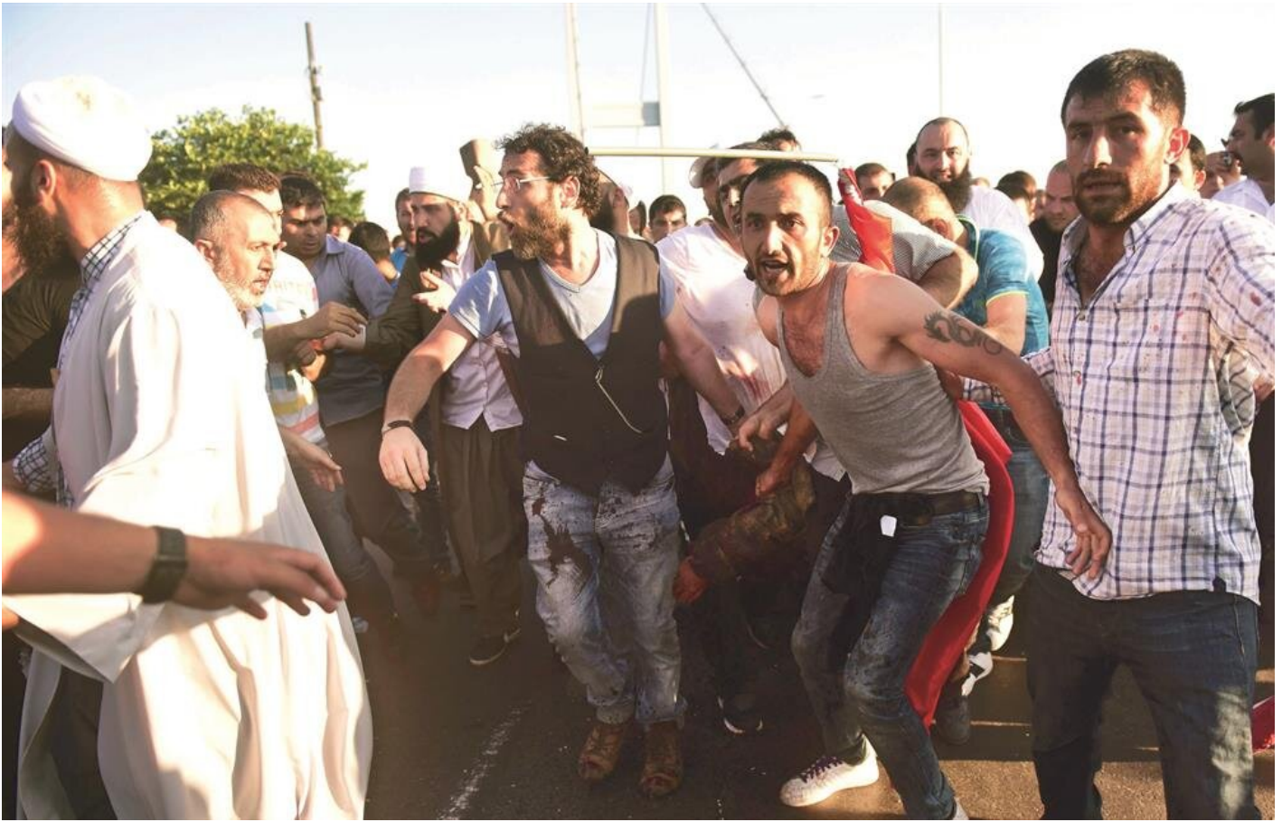
Ali Nuri Türkoğlu ve arkadaşları yaralı askeri ambulansa yetiştirmeye çalışırken IŞİD'ci ilan edildiler.

İkinci fotoğraf ise Oyuncu Ali Nuri Türkoğlu'nun olaya ilişkin açıklama getirmesi ile netleşti. Bahsi geçen fotoğrafta başta Ali Nuri Türkoğlu olmak üzere yanında bulunan sakallı ve cübbeli kişilerin askeri linç ettiği iddiası ortaya atıldı. Türkoğlu'nun fotoğraf ile ilgili açıklaması, iddia edilenin aksine askeri linçten kurtarmaya çalıştıkları ve ambulansa yetiştirmek için arabaya götördükleri şeklindeydi.