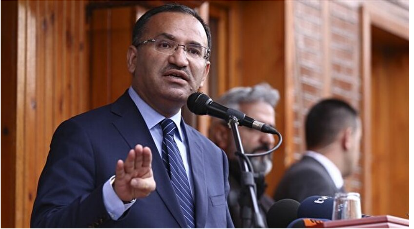
Adalet Bakanı Bekir Bozdağ