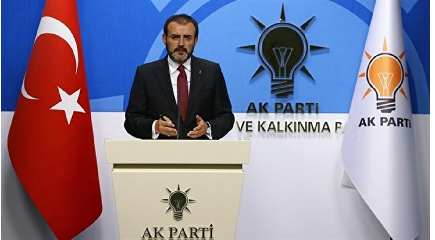
AK Parti Sözcüsü Mahir Ünal

Haber Merkezi · 18 Temmuz 2017, 16:38 · Son Güncelleme: 18 Temmuz 2017, 18:05 · Yeni Şafak