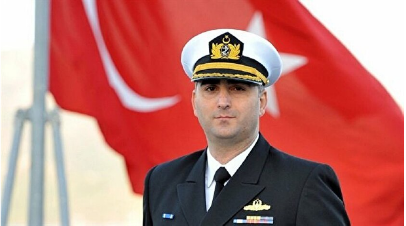
Eski Deniz Kuvvetleri Genel Sekreteri Saral

Haber Merkezi · 29 Eylül 2017, 20:09 · Son Güncelleme: 29 Eylül 2017, 20:12 · AA