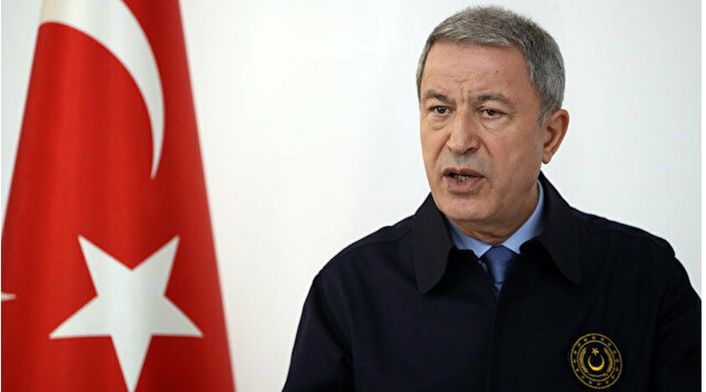
Milli Savunma Bakanı Akar