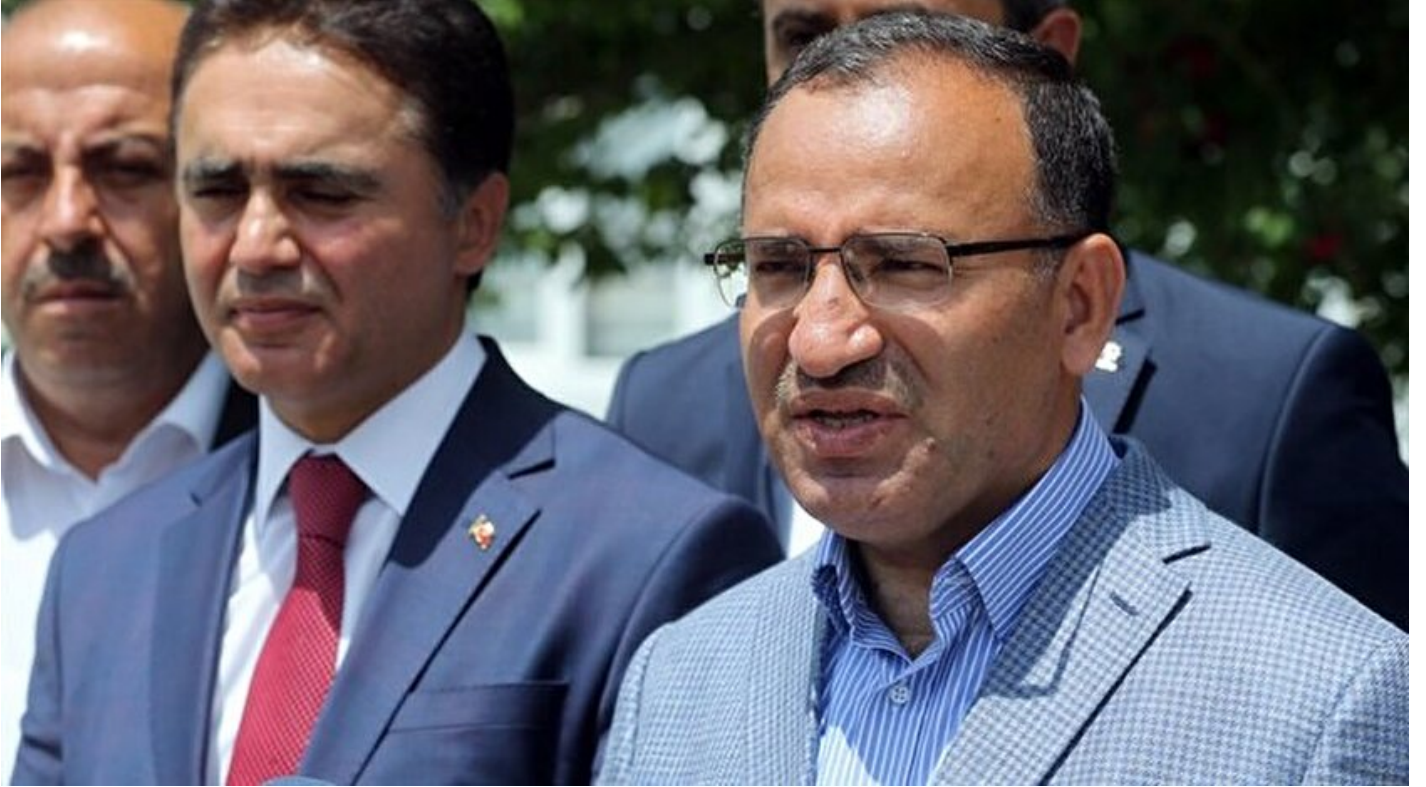
Başbakan Yardımcısı Bekir Bozdağ