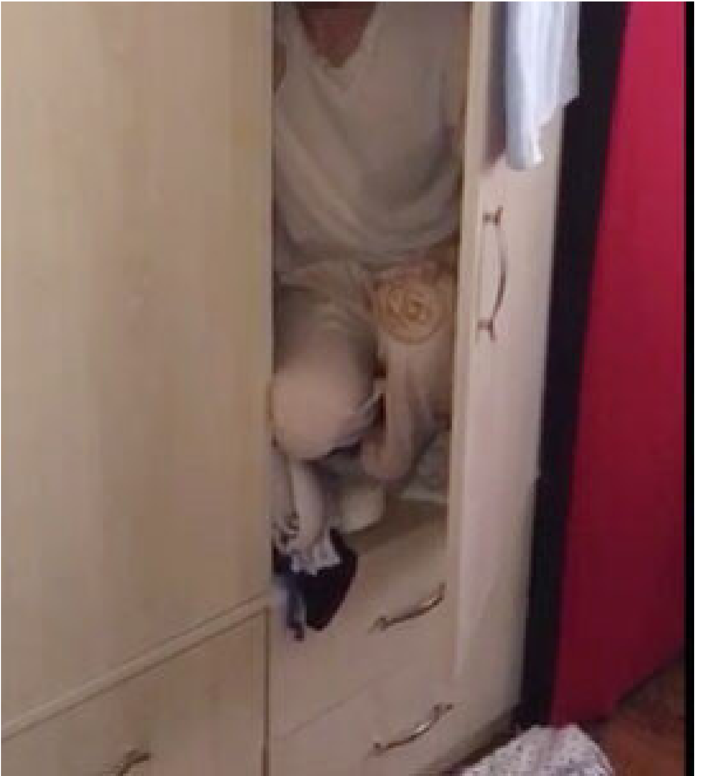
Nöbetçi sulh ceza hakimliğince zanlıların tamamı tutuklandı.