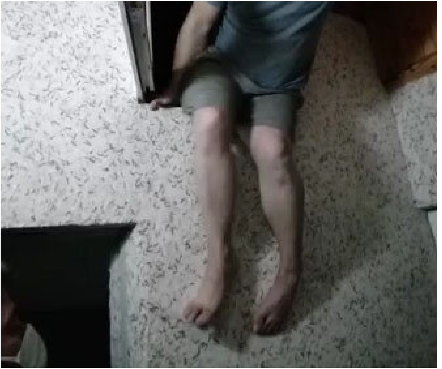
Sorgularının ardından 4 kiři, adliyeye sevk edildi.