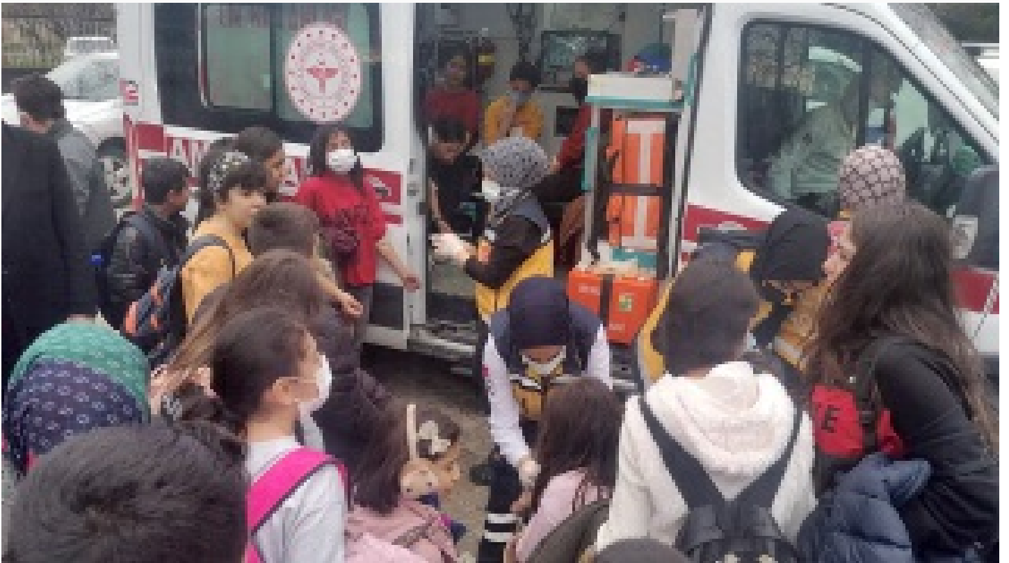
70 öğrenci hastaneye kaldırıldı