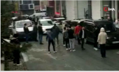
Uçan tekmeli kavga: Kaldırım taşları havada uçtu