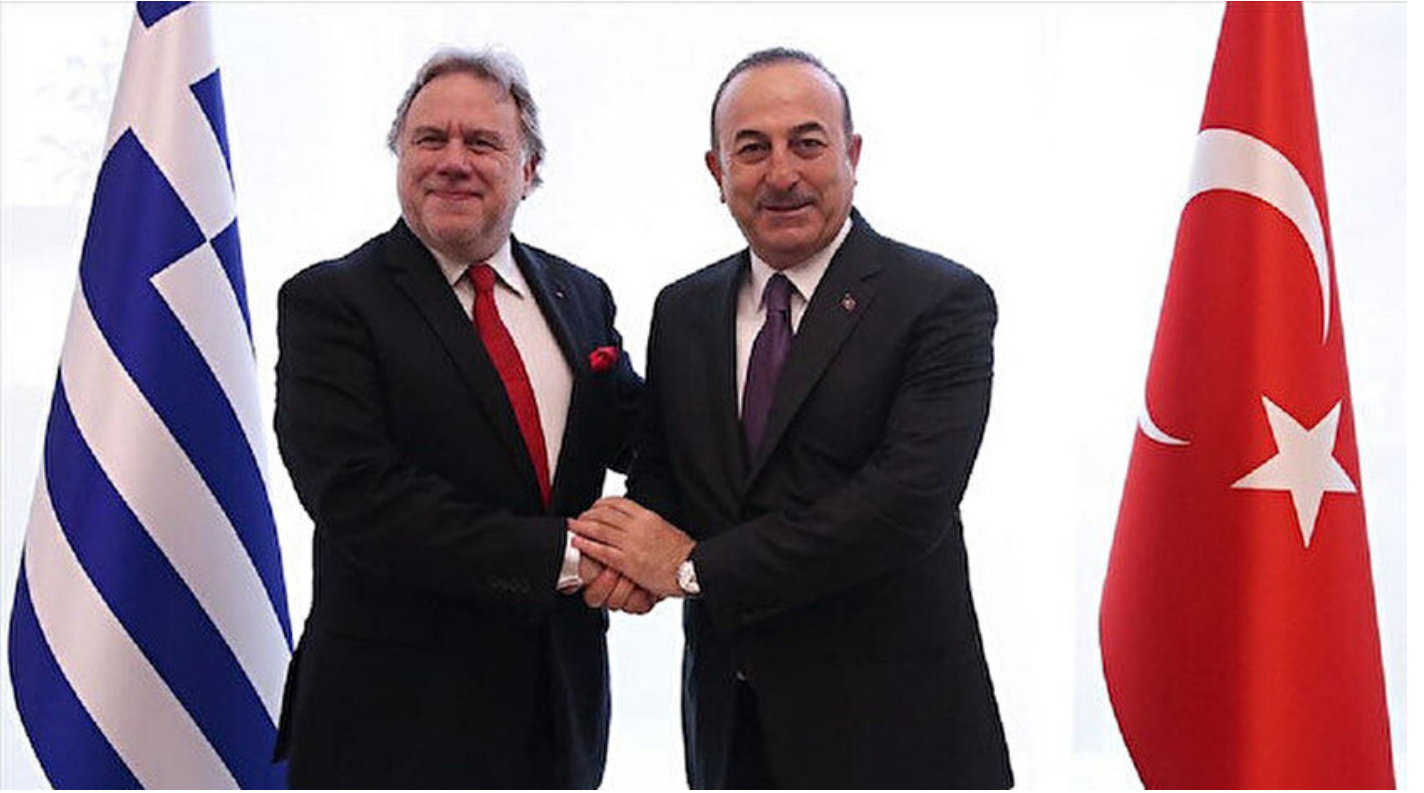
Georgios Katrugalos - Mevlüt Çavuşoğlu

Haber Merkezi · 21 Mart 2019, 11:14 · Son Güncelleme: 21 Mart 2019, 12:25 · AA