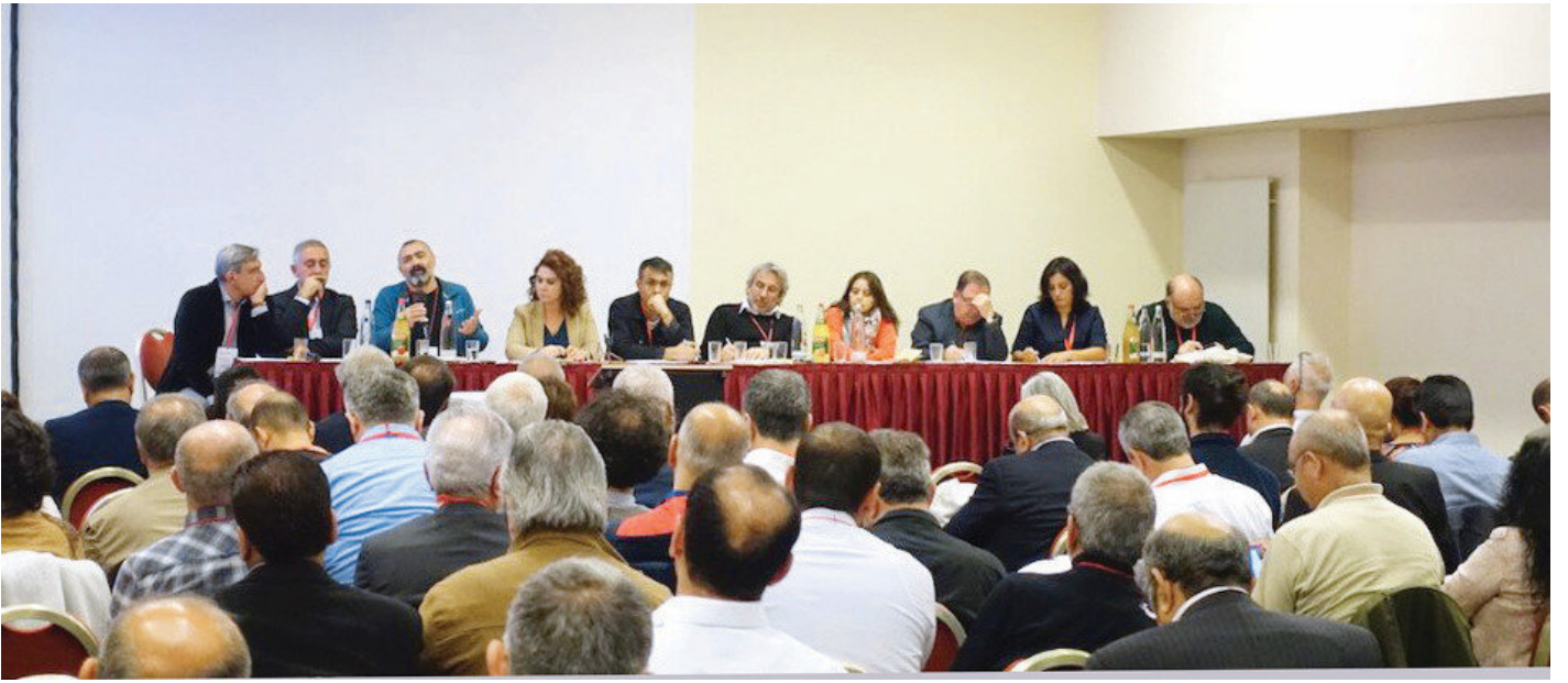
Demokratik Türkiye için Toplumsal Sözleşme Arayış isimli konferans