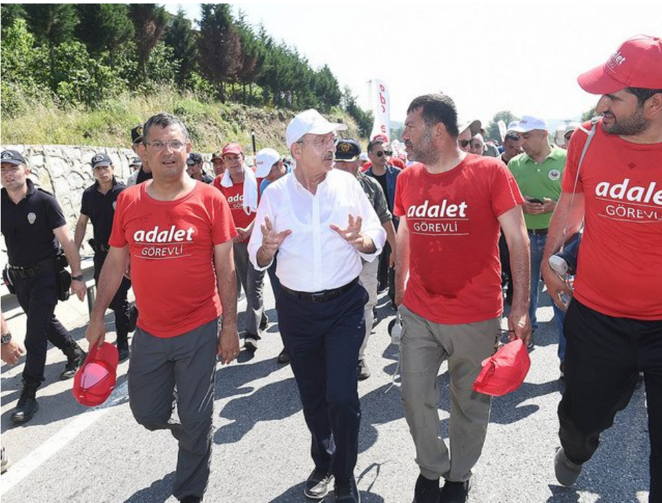
TOPUKLARI İLTİHAPLANDI YÜRÜMEKTEN VAZGEÇMEDİ