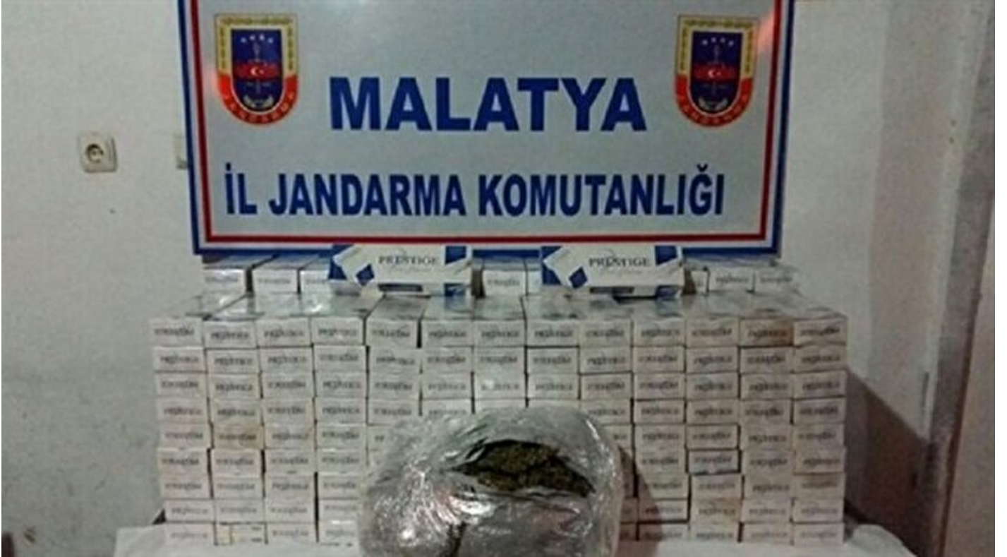
Malatya'da kaçak sigara ve uyuşturucu operasyonu

Haber Merkezi · 14 Şubat 2017, 18:58 · Son Güncelleme: 14 Şubat 2017, 19:00 · IHA