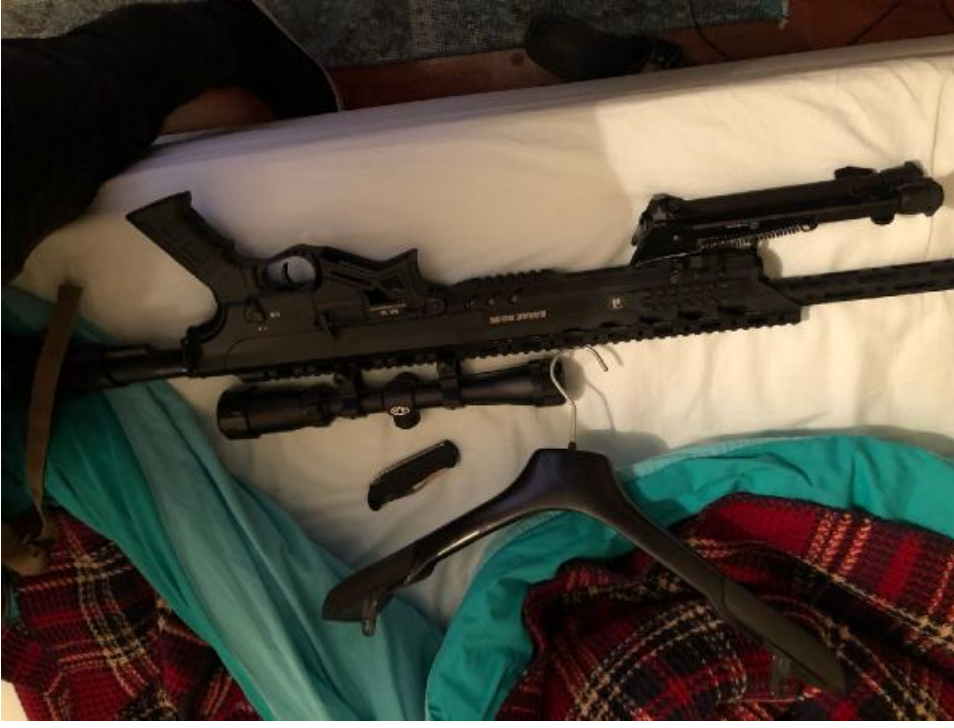
İŞTE GÖZALTI FOTOĞRAFLARI