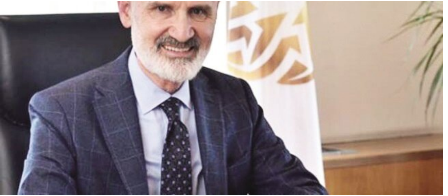
İstanbul Ticaret Odası (İTO) Başkanı Şekib Avdağı