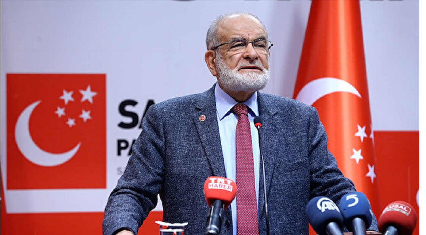
Saadet Partisi Genel Başkanı Temel Karamollaoğlu

Haber Merkezi · 31 Mart 2019, 21:40 · AA