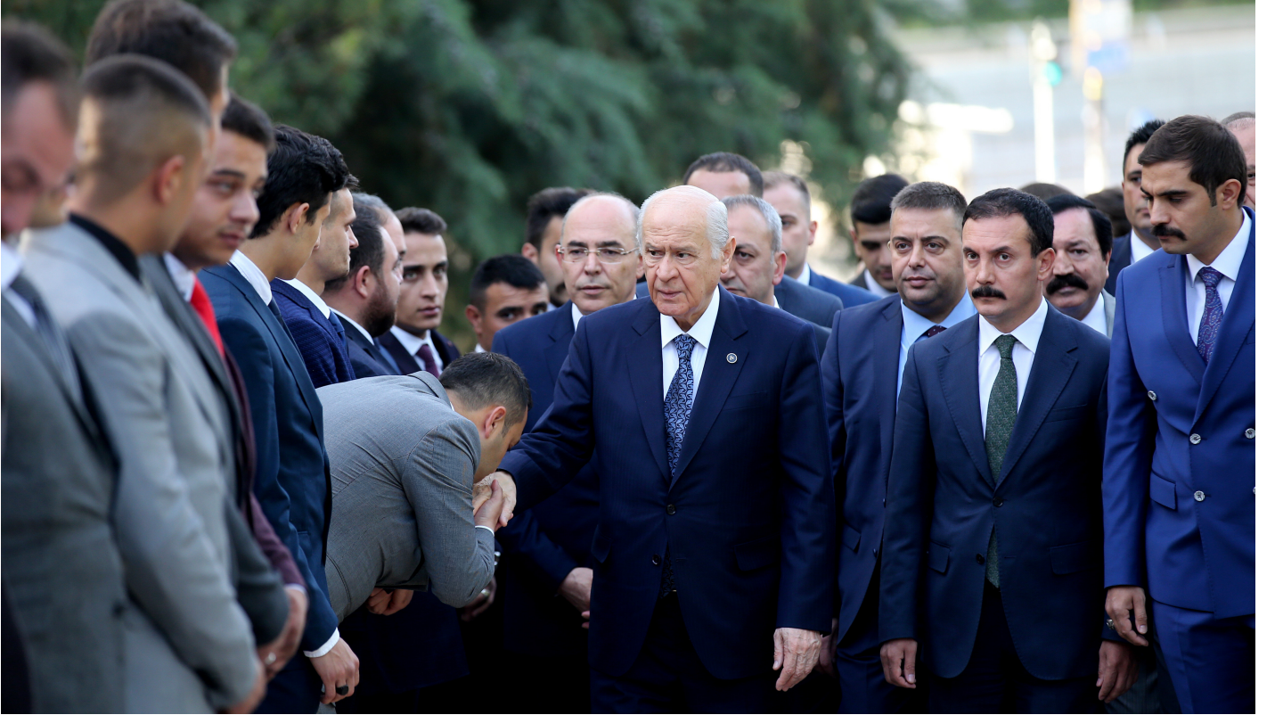
MHP Lideri partililerle bayramlaştı.

“ Ve bütün bunlar olurken de özellikle terörle mücadele kapsamında en son yapılmış olan 'Pençe' hareketinde şehitlerimiz olmuştur. Türkiye üzüntülü bir dönem yaşamıştır.