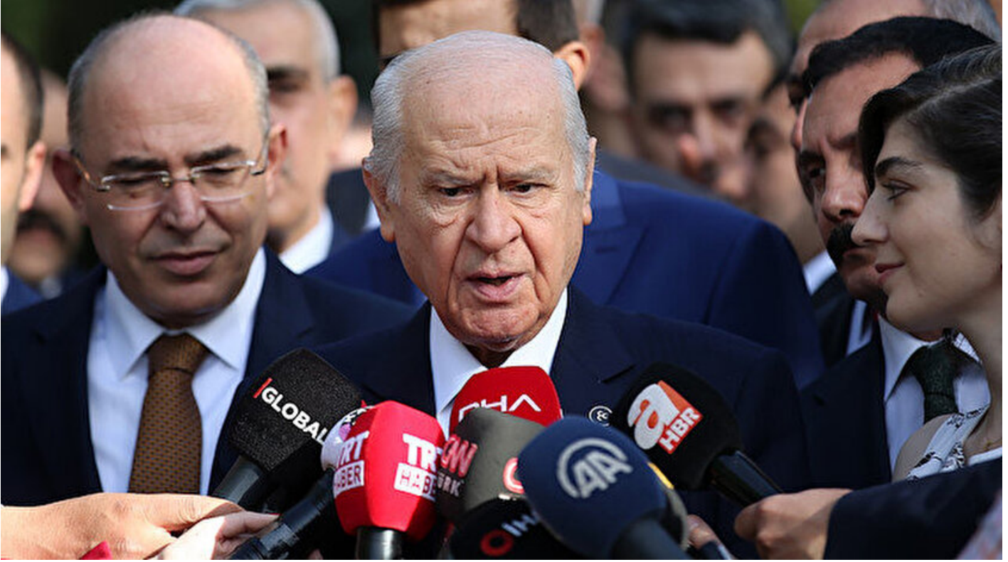
MHP Lideri Devlet Bahçeli.

Haber Merkezi · 04 Haziran 2019, 09:10 · Son Güncelleme: 04 Haziran 2019, 09:35 · AA