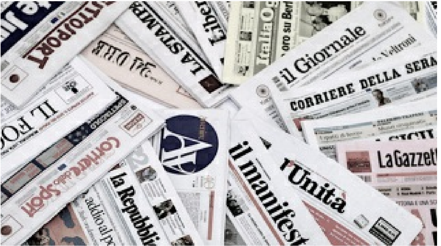
Rusya'dan Batı'nın medya ambargosuna cevap