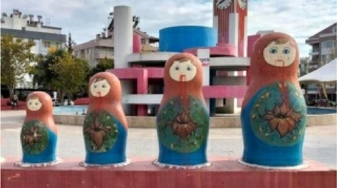
Antalya'da matruşkalara boyalı saldırı