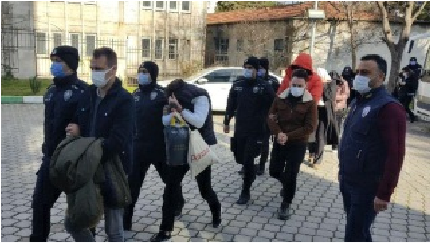
5 ilde yasa dışı bahis operasyonu: 20 gözaltı