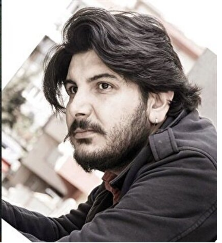
Medyaya Bylock operasyonu