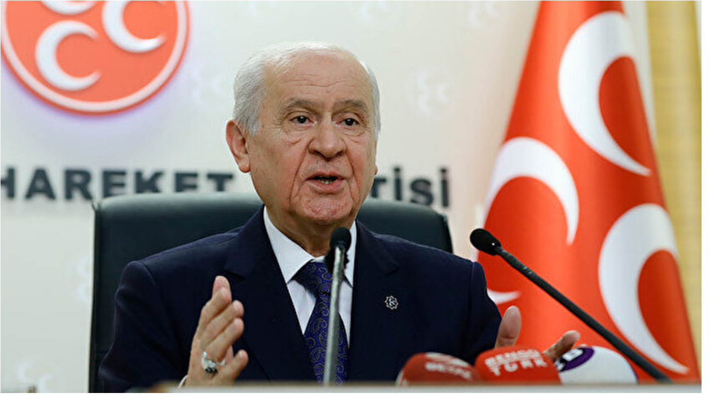
MHP Lideri Bahçeli.

Haber Merkezi · 04 Nisan 2019, 17:15 · Son Güncelleme: 04 Nisan 2019, 17:20 · Yeni Şafak