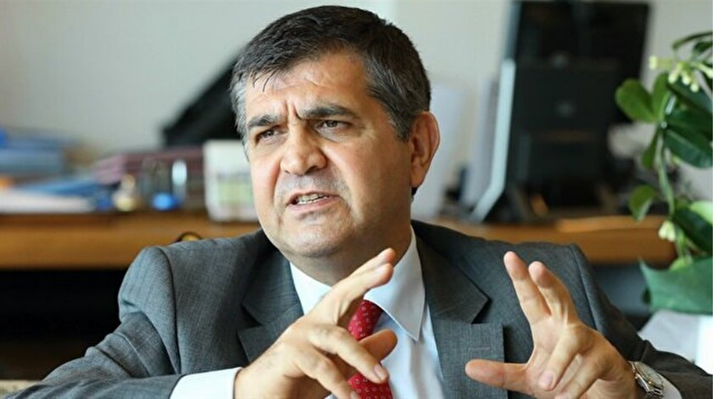
Türkiye'nin Avrupa Birliği (AB) Daimi Temsilcisi Faruk Kaymakcı

Haber Merkezi · 22 Kasım 2017, 20:46 · Son Güncelleme: 22 Kasım 2017, 20:56 · AA