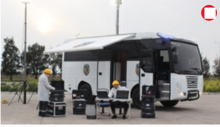
EGM'ye 10 KIRAÇ daha teslim edildi