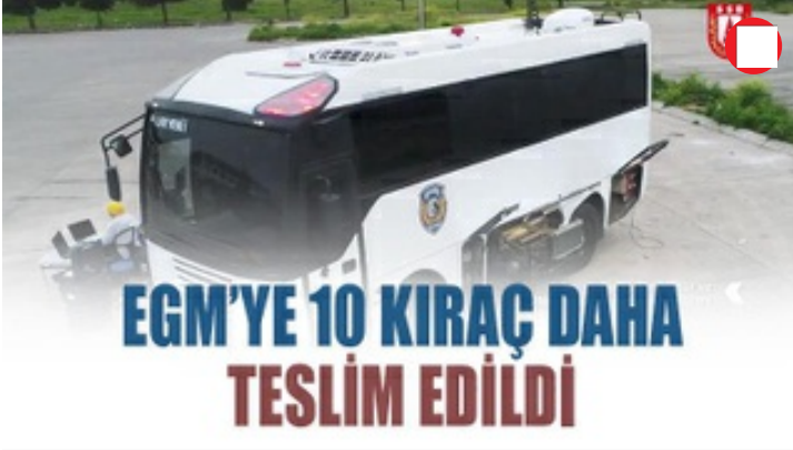
EGM'ye 10 KIRAÇ daha teslim edildi