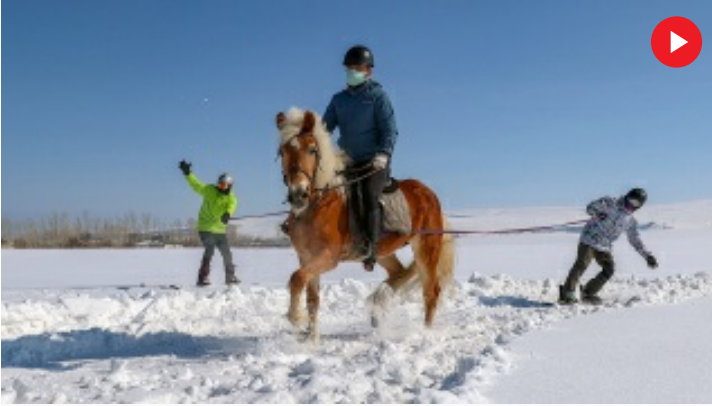
Van'da sporcular karda 'atlı snowboard' yaptı