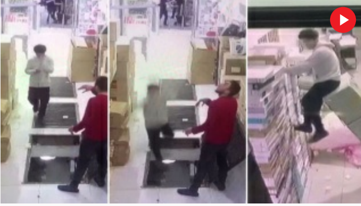
Telefonuna bakarken alt kata düştü!