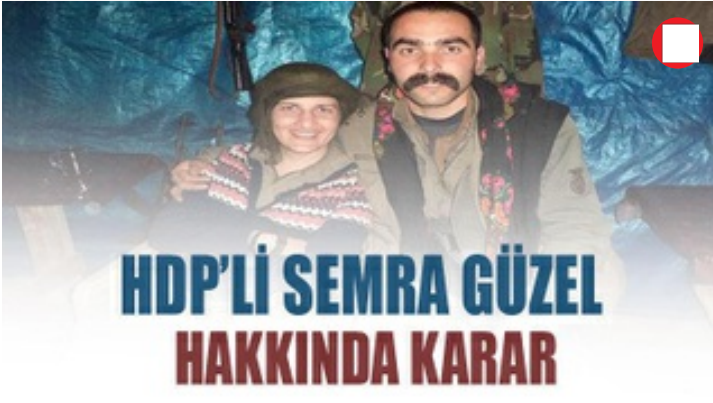
HDP'li Semra Güzel'in dokunulmazlığının kaldırılması kararı verildi