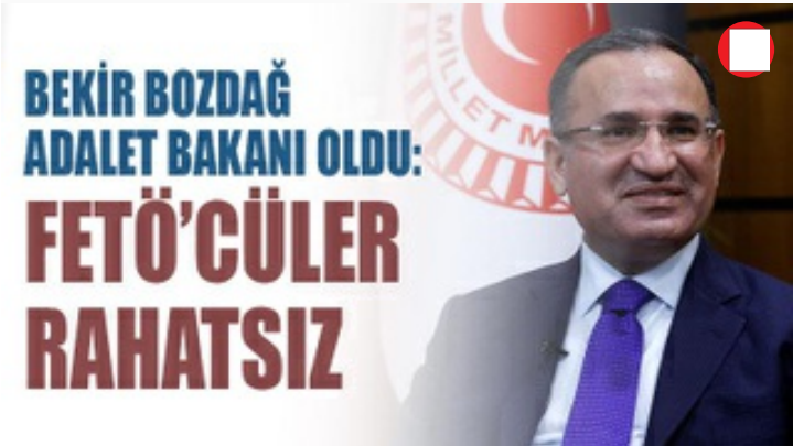
Bekir Bozdağ Adalet Bakanı oldu: FETÖ'cüler rahatsız