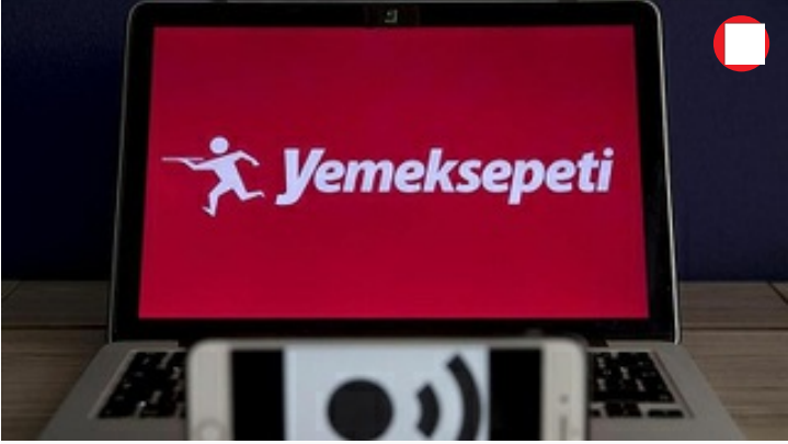
Yemek Sepeti kuryeleri, İstanbul ve İzmir'deki eylemlerinde haklarını istedi