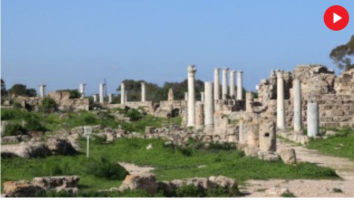
KKTC'de binlerce yıllık geçmişe sahip antik kent: Salamis Harabeleri