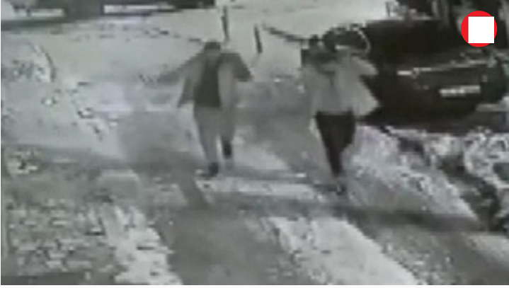
Mahmutyazıcıoğlu cinayetinde saldırganların kaçış anı ortaya çıktı