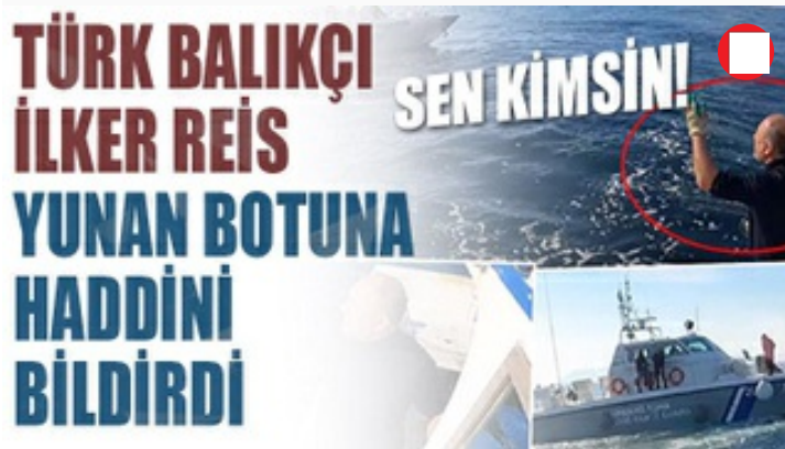
Türk balıkçı, Yunan sahil güvenliğine haddini bildirdi