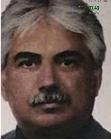
BTXN Coin 37.43 0.64%

ABD'nin İstanbul Başkonsolosluğu görevlisi Emniyet müdürünü ABD'de savcıyla görüşürdüğünü itiraf etti