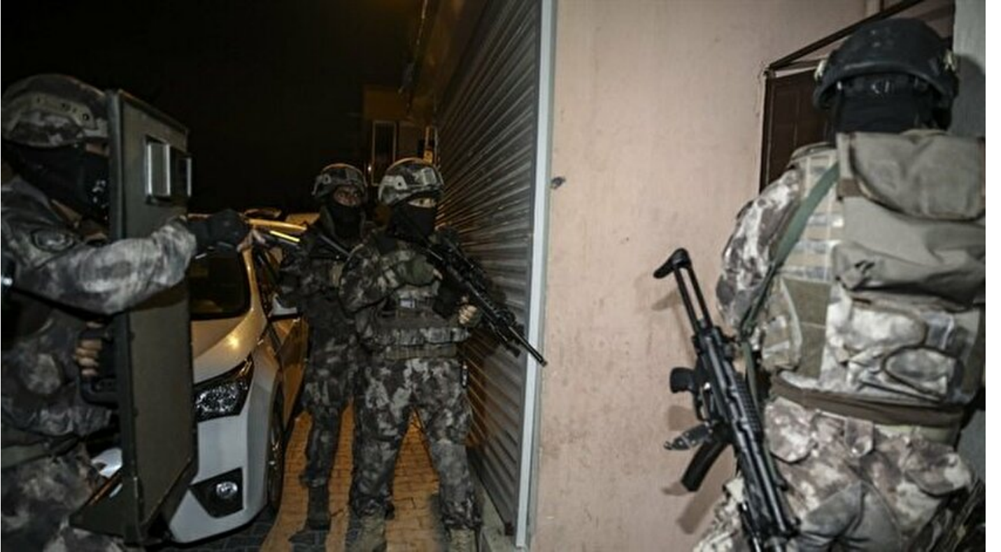
Adana'da uyuşturucu operasyonu