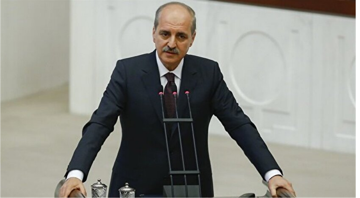
Başbakan Yardımcısı Kurtulmuş

Haber Merkezi · 18 Nisan 2017, 18:31 · Son Güncelleme: 18 Nisan 2017, 18:36 · AA