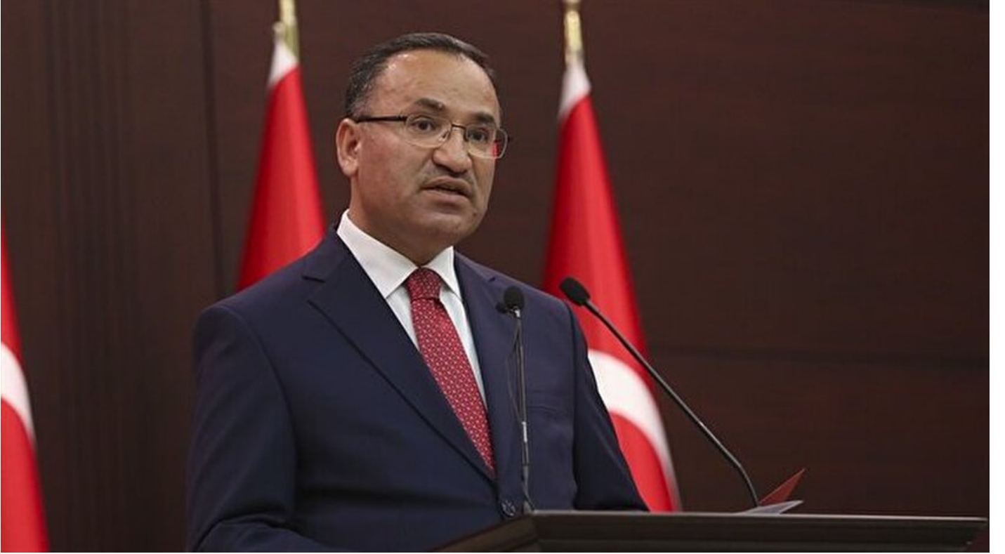
Başbakan Yardımcısı ve Hükümet Sözcüsü Bekir Bozdağ

Haber Merkezi · 28 Kasım 2017, 21:42 · Son Güncelleme: 28 Kasım 2017, 21:51 · Yeni Şafak